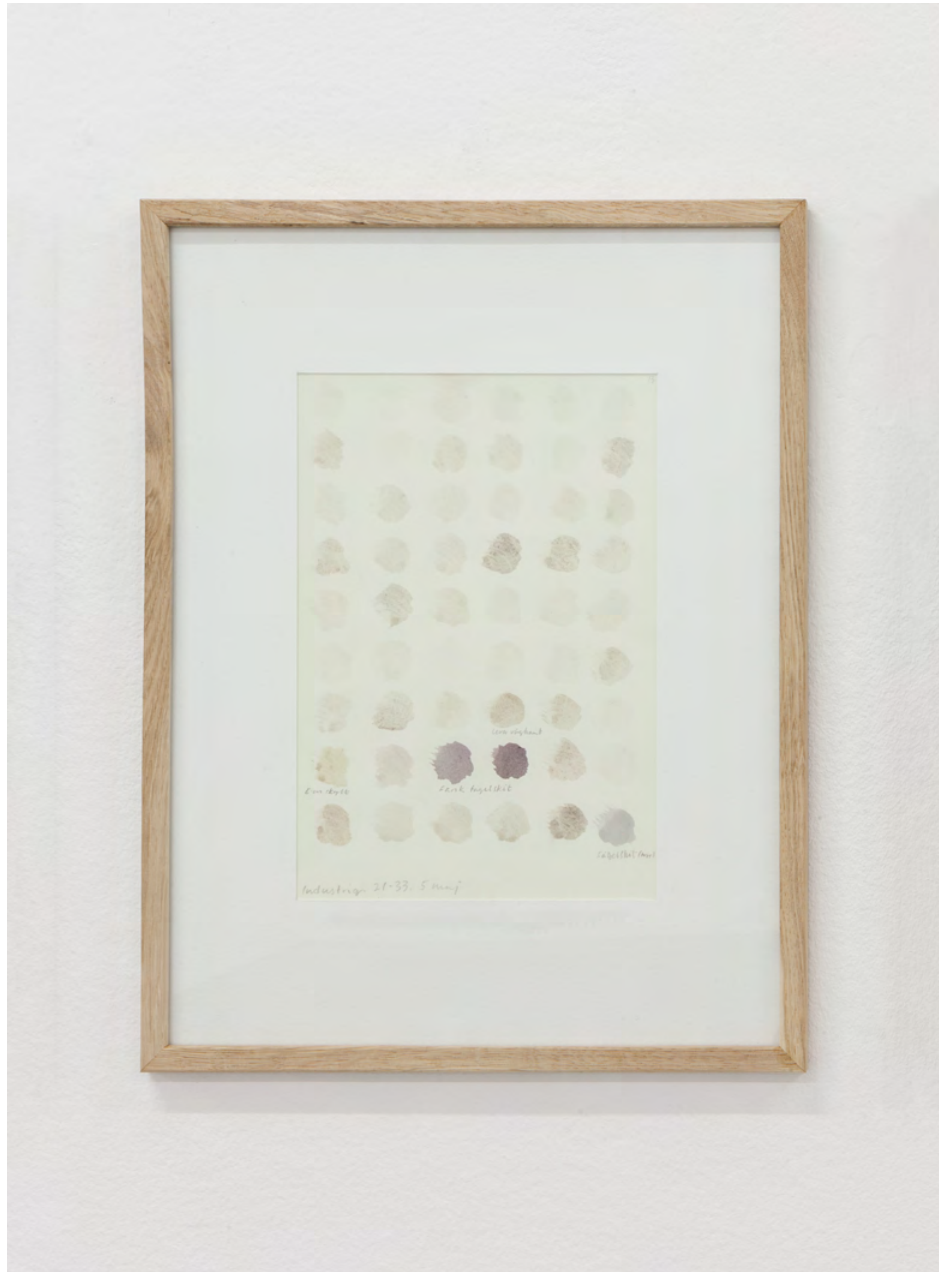
Olle Helin Färgkarta #13, 2020 Funna pigment på akvarellpapper Detalj från Colour Research i Galleri KHM2, Malmö 18 x 26 cm