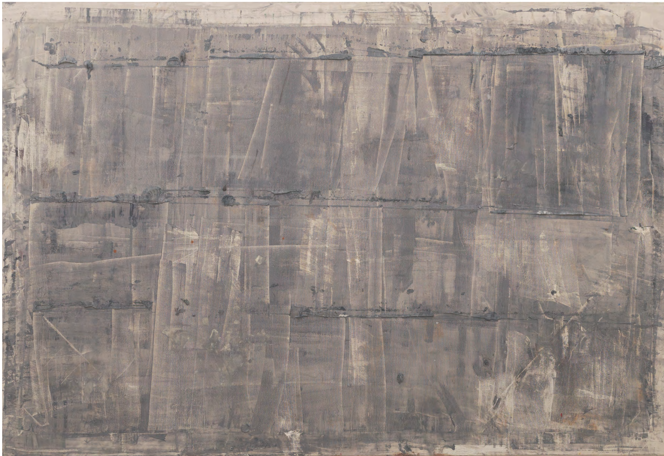
Nicklas Randau Orkesterdiket (universum) , 2020 188 × 283 cm