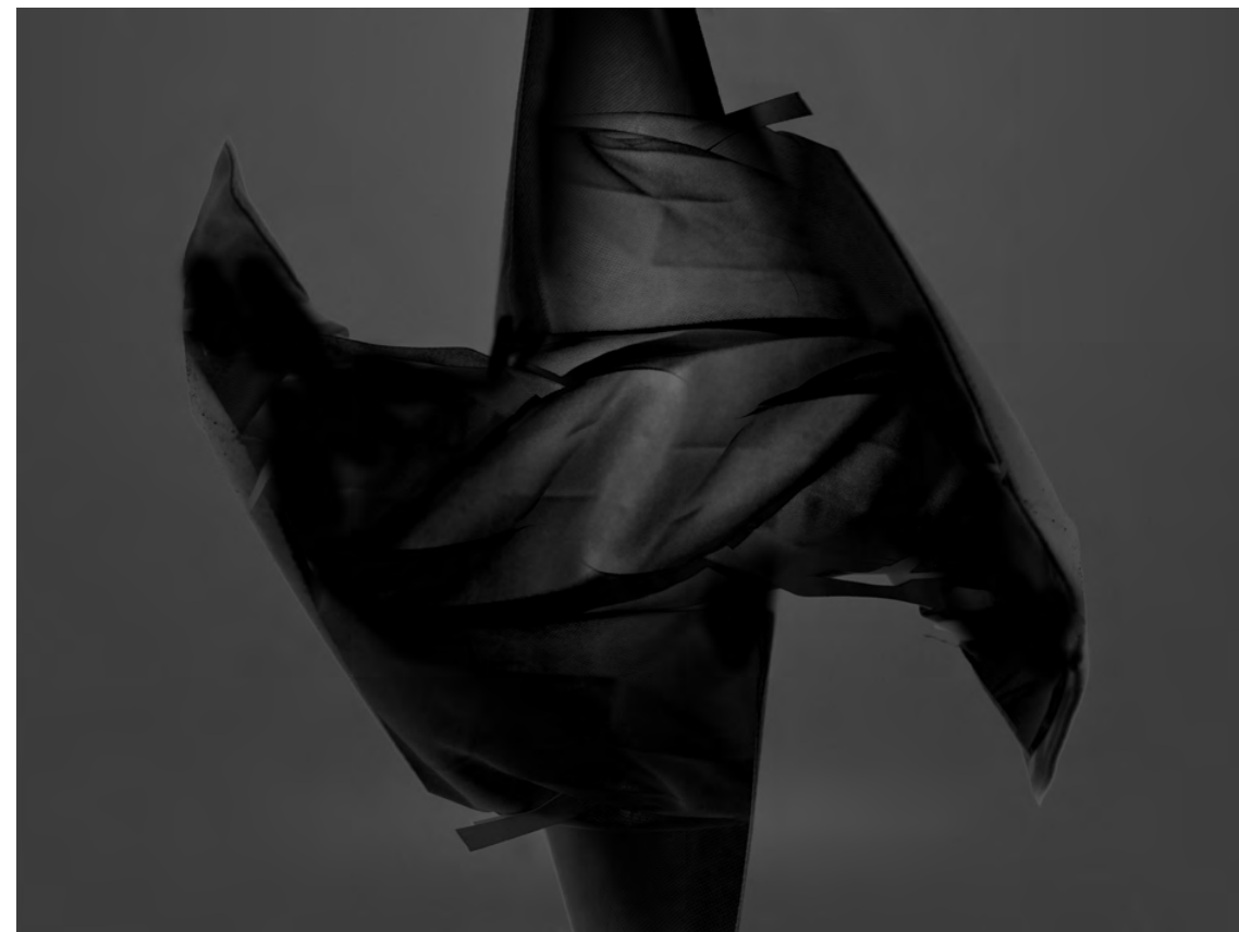
Dag Kewenter Untitled (Cornette 12) , 2021 Kromogen print 65 × 48,5 cm