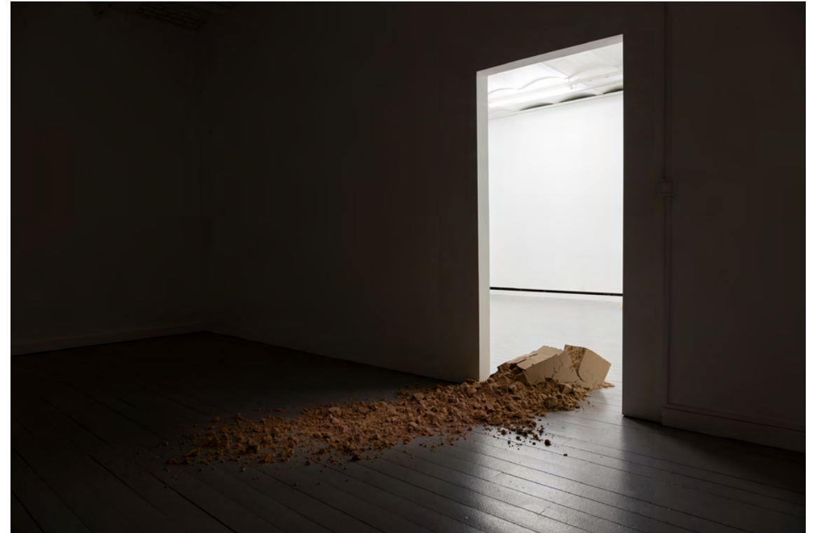
Fanny Hellgren Collapse 4 , 2021 Packad sand 300 × 60 × 30 cm Installationsvy: Terra Incognita , MFA-utställning, Galleri KHM2, 2021