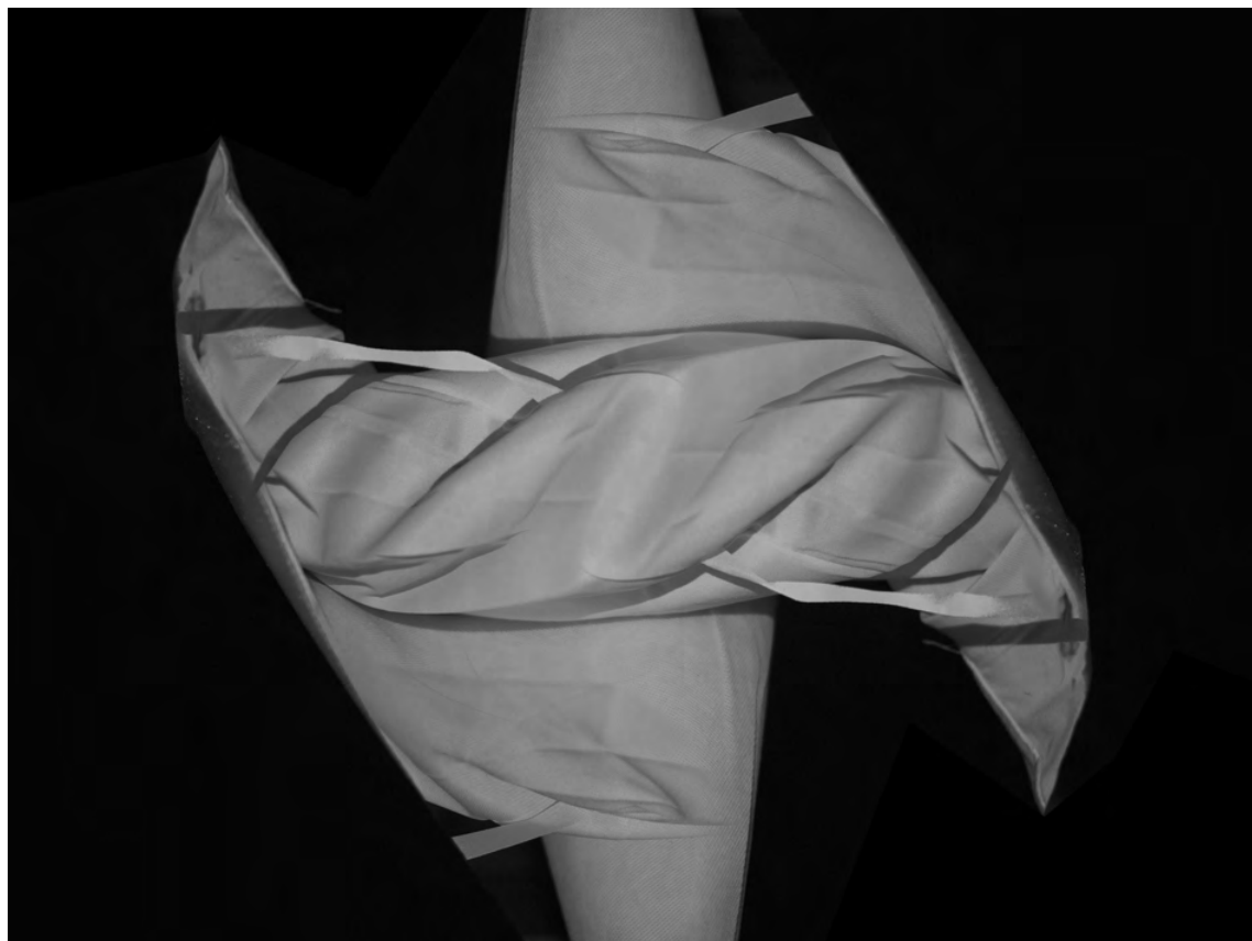
Dag Kewenter Untitled (Cornette 1) , 2021 Kromogen print 65 × 48,5 cm