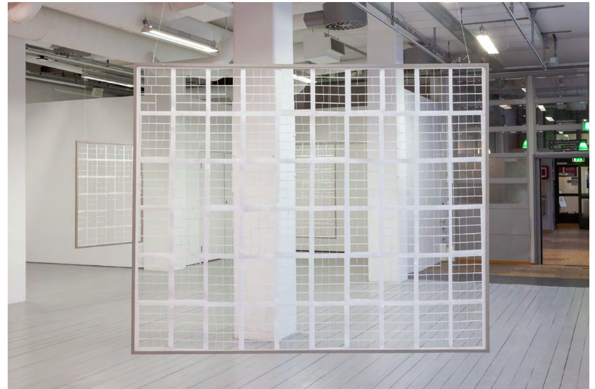
Louise Hammer In other words , 2021 Ekträ, träbets, serietidning, akrylfärg 264 x 208 cm