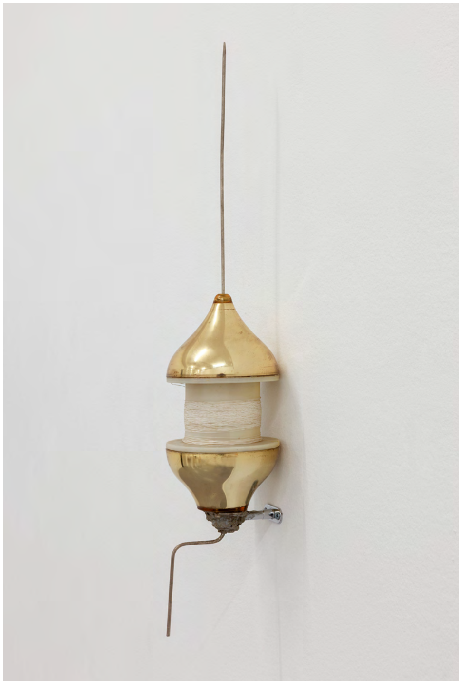
Dag Kewenter Set twice, 2021 Flaggstångsknopp, spole, sytråd, metall, cement, epoxylim