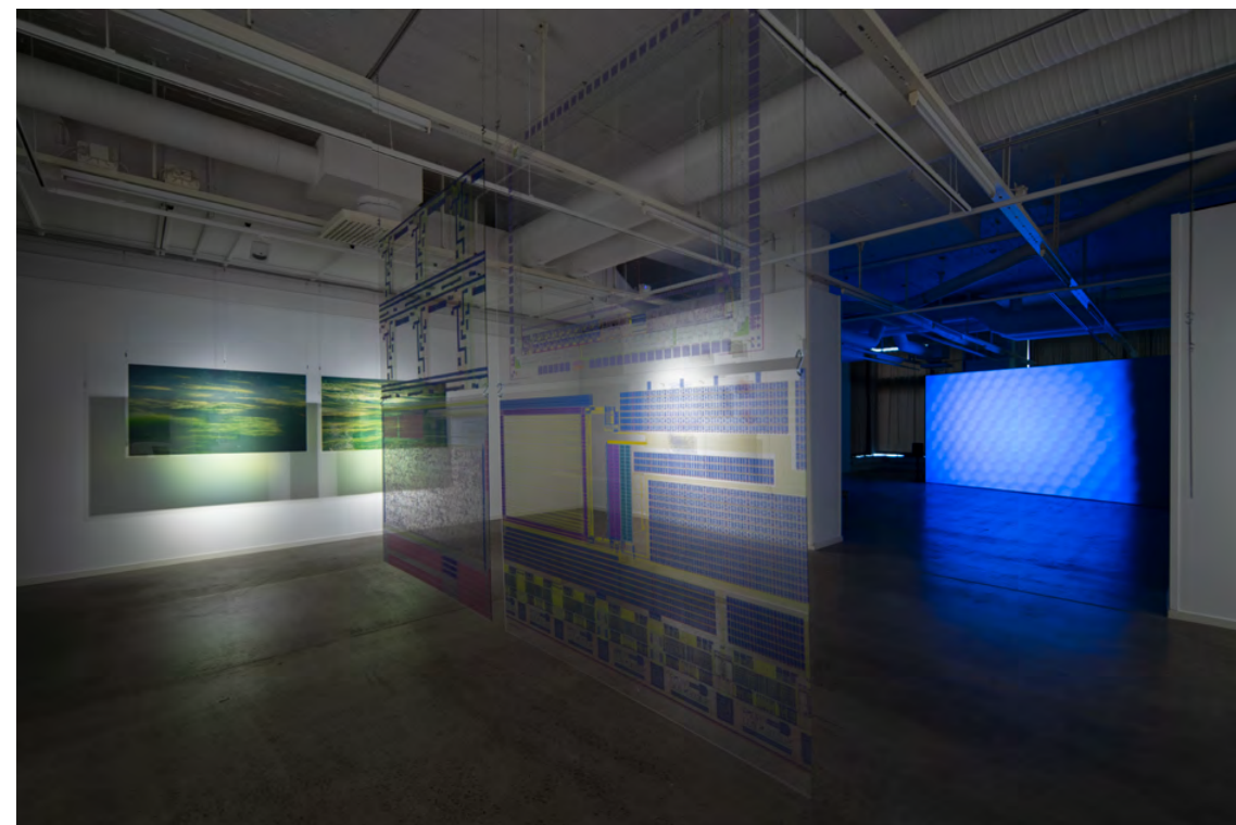
Lena Bergendahl Notes on An Image of What You See , 2021 Digital print på plexiglas Varierande dimensioner Installationsvy: An Image of What You See , Galleri Format, Malmö

Residencies: Jan van Eyck Academie, Maastricht, Nederländerna, 2017 / Cultural, Documents, Filignano, Italien, 2015-2019 / Swing Space Artist Residency, Lower Manhattan Cultural Council, New York, USA, 2013