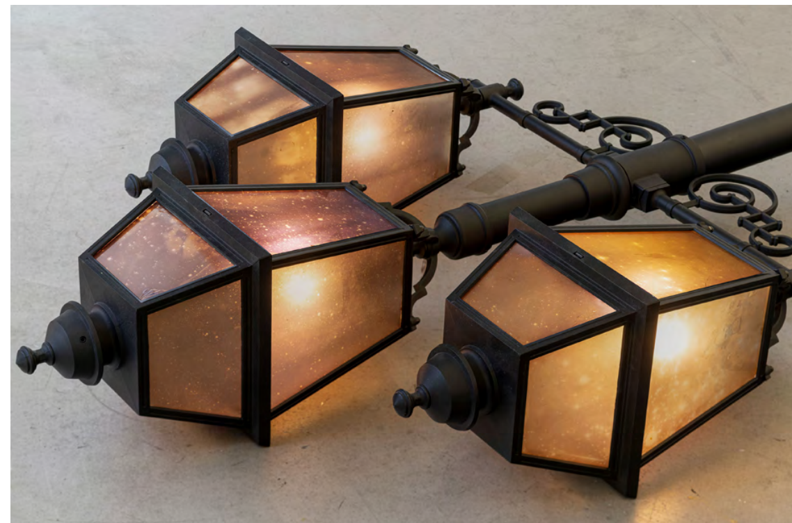
Johan Österholm Luminous Reign (Toppled) , 2021

Tammerfors Konstmuseum, 2020 / Milchstrassenverkehrsordnung , Künstlerhaus Bethanien, 2019 / C/O Berlin Magazine , essä av Caroline von Courten, 2018 / Camera Austria Forum , 2018 / The Polaroid Project: Art & Technology , FEP & Thames&Hudson, 2017