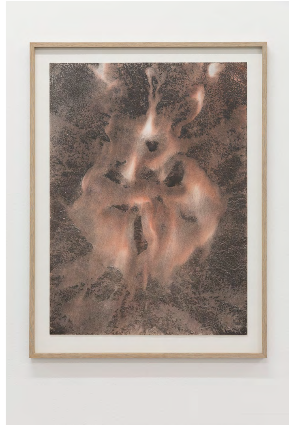
Fanny Hellgren Sediment Drawing 6 (Map of the Unknown) , 2020 Grafit och pigment på papper 75 × 54,5 cm (ram 86,5 × 65 cm)

Installationsvy: Terra Incognita , MFA-utställning, Galleri KHM2, 2021