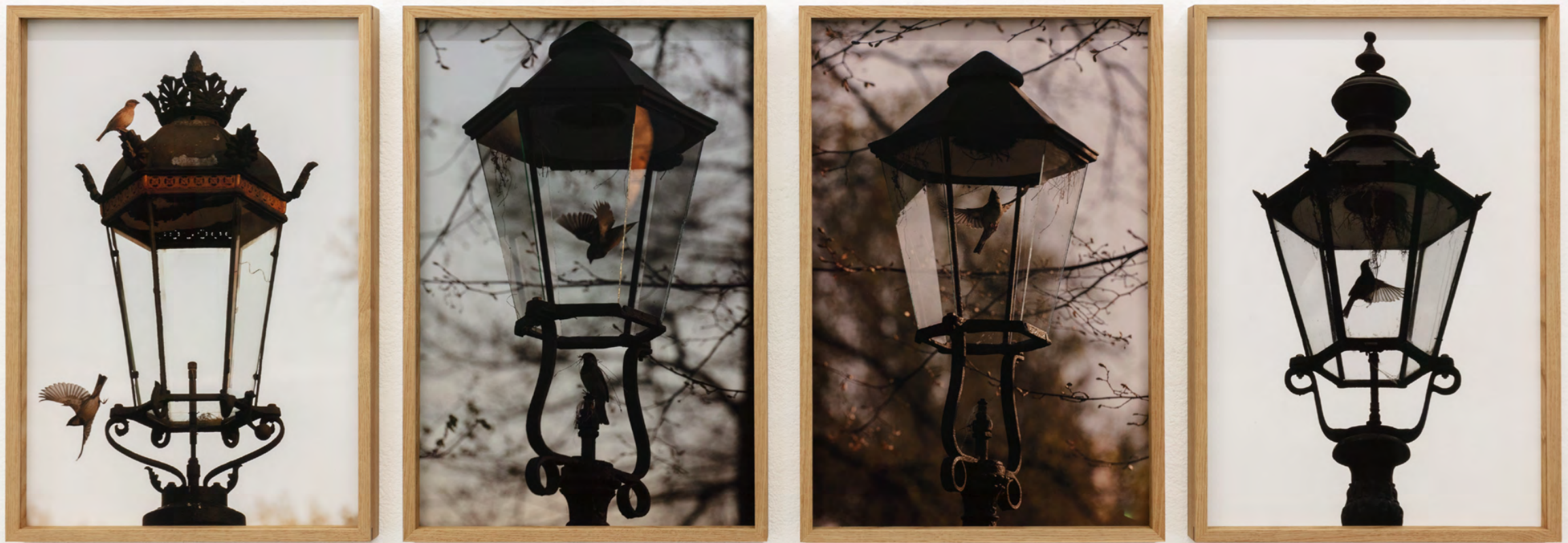
Johan Österholm Lantern Smashers , 2018

Studie av gaslyktor som ockuperats av sparvbon, vilket släcker lyktan för resten av häckningsperioden och skänker staden lite mörker.