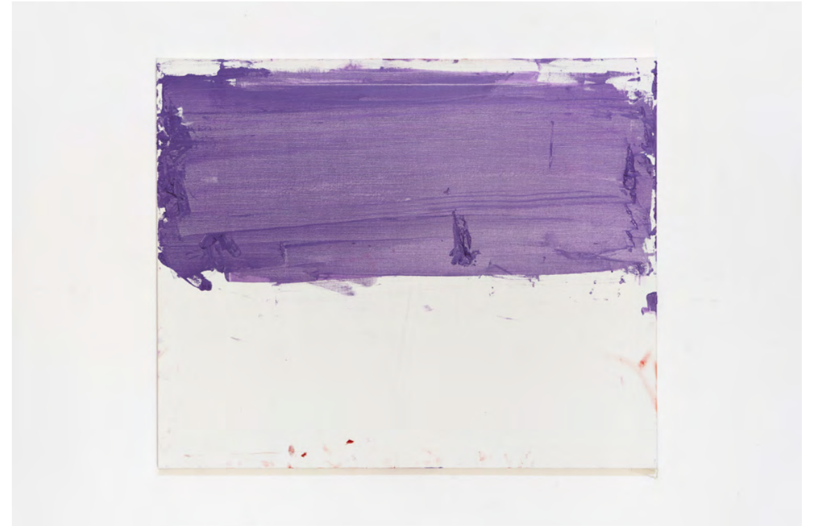
Nicklas Randau Nattljus , 2021 Olja på duk 115 x 140 cm

Samlingar: Malmö konstmuseum, Privata samlingar