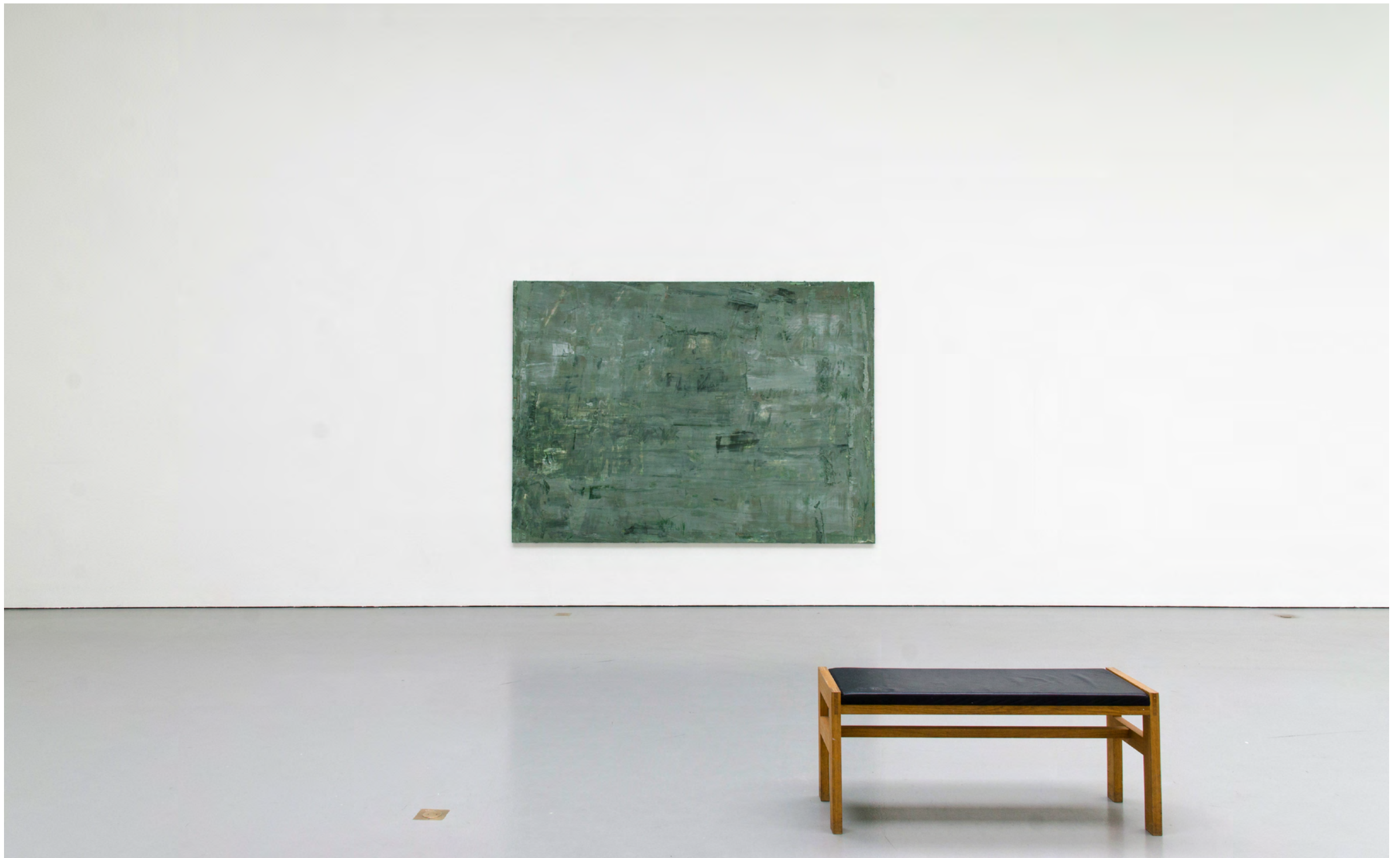
Nicklas Randau Atlantis (grön) , 2018 Olja på duk 260 × 195 cm