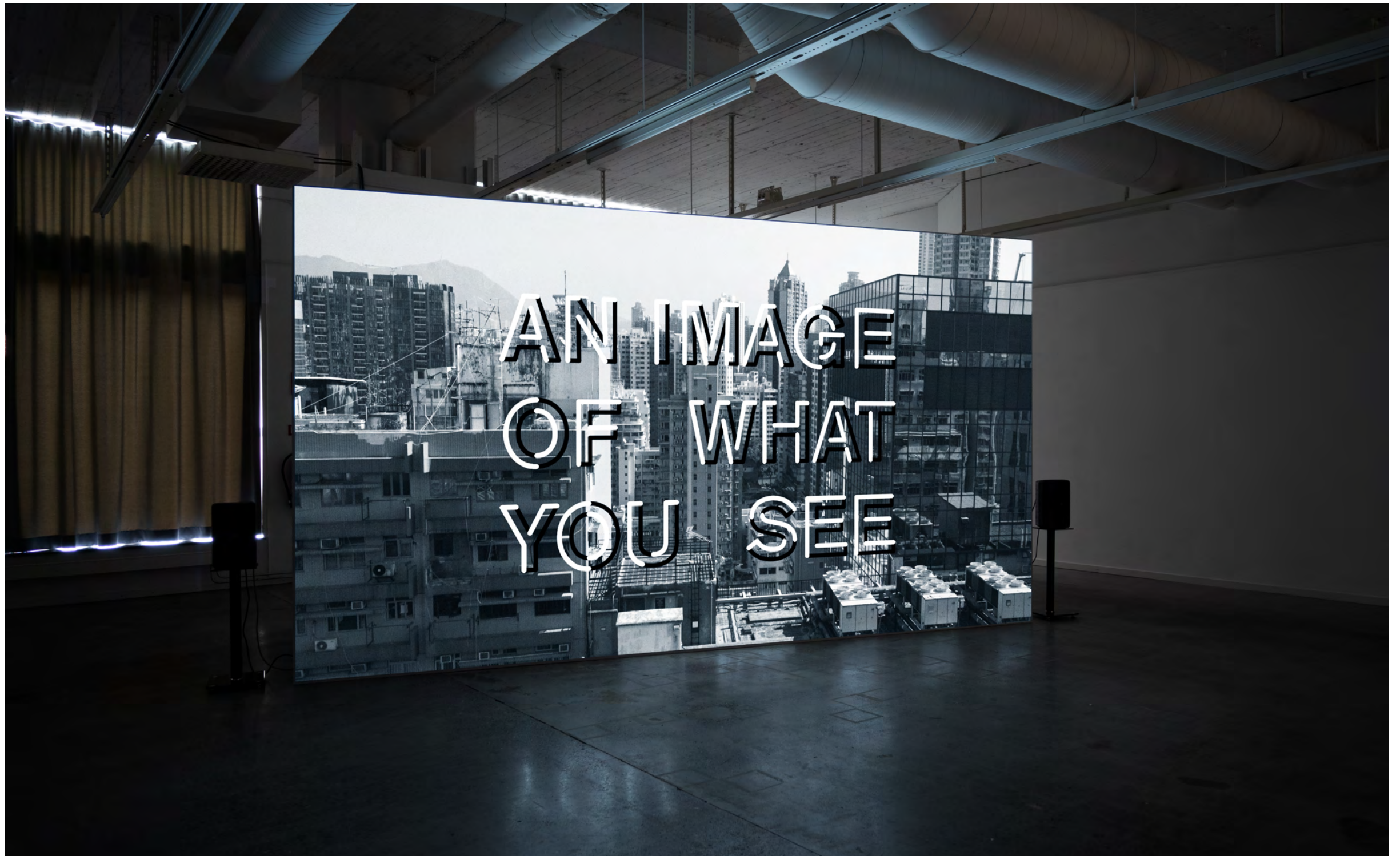
Lena Bergendahl An Image of What You See , 2021 4k överförd till HD, 21.24” Installationsvy: An Image of What You See , Galleri Format, Malmö