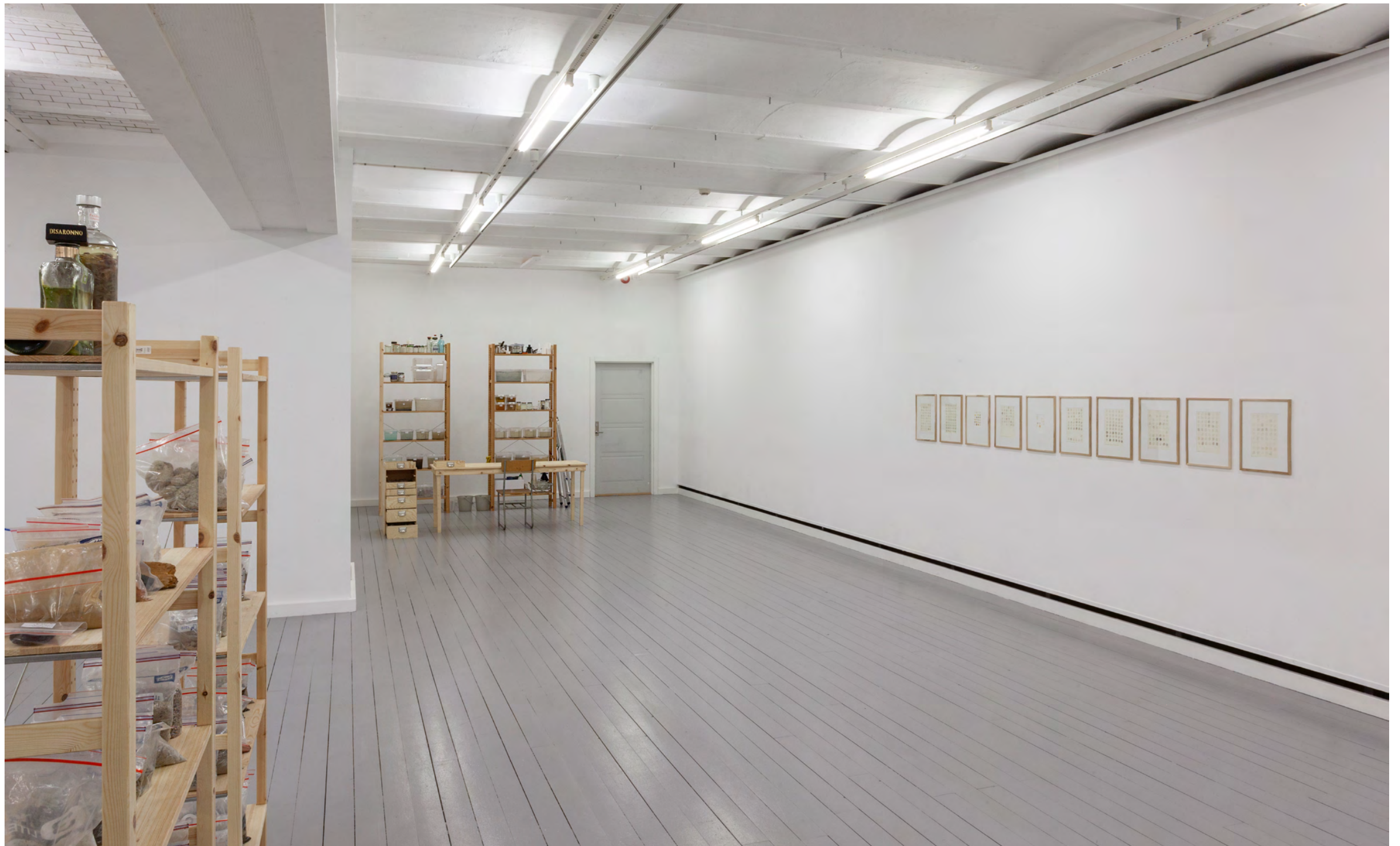
Olle Helin Colour Research , 2021 Installationsvy, Galleri KHM2, Malmö