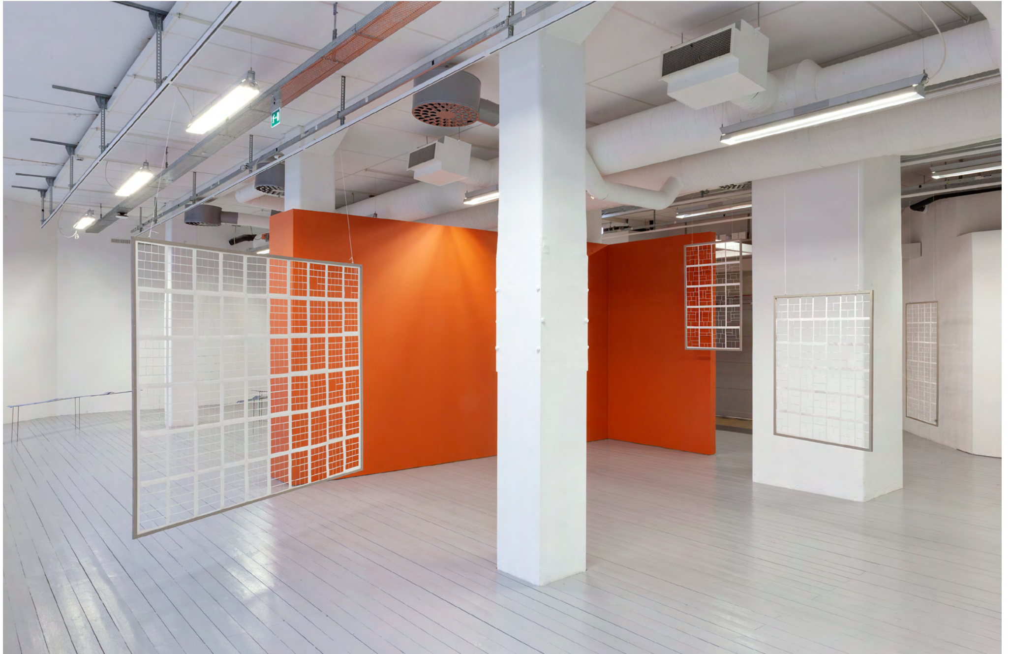
Louise Hammer In other words , 2021 Ekträ, träbets, serietidningar, akrylfärg Varierande dimensioner