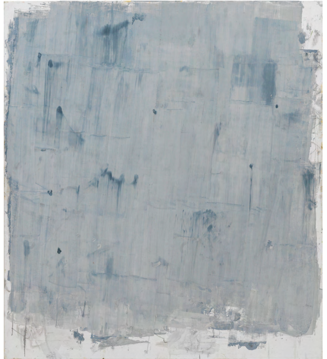
Nicklas Randau Tustens fågelskrift , 2020 Olja på duk 195 × 175 cm