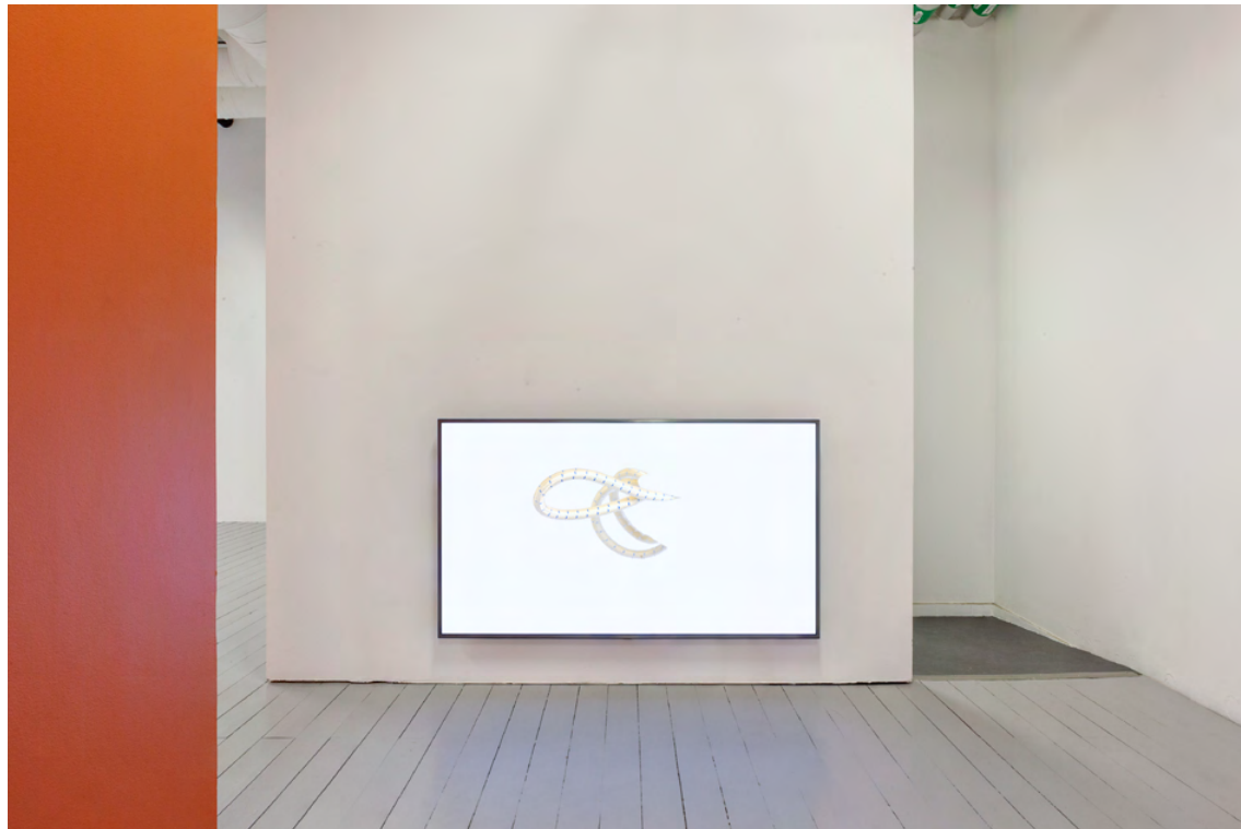
Louise Hammer Motif , 2021 Video 05:23 min

Övrigt: Organisatör och kurator för DELFI, Malmö 2018-2021